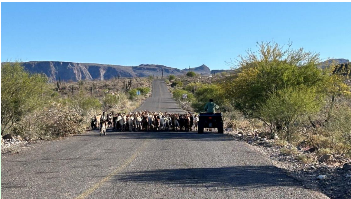
Figura 5. Caprinocultor arriando un rebaño de cabras al corral de ordeña.

pastoreo y el número de animales a mantener, y esto modifica la salud del suelo y la vegetación. Así bien, el rebaño se dirigirá hacia el área del agostadero que el caprinocultor disponga (Fig. 5) y, dependiendo del manejo, también influirá en el tiempo que el rebaño se aleje del corral. El contexto socioambiental, la temporada y la estrategia de pastoreo tienen una fuerte influencia en la forma en que el ganado selecciona los recursos forrajeros y por ende sus rutas de pastoreo (Liao et al. 2018).