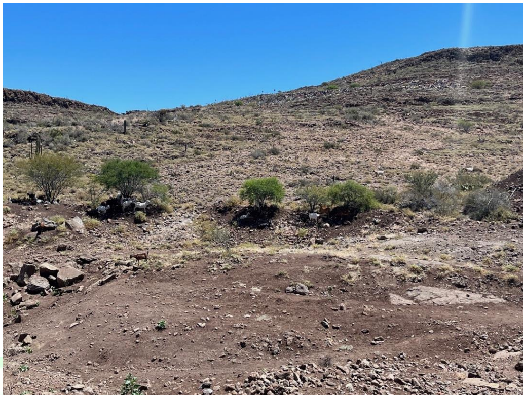
Figura 4. Cabras en pastoreo tradicional protegiéndose del sol.

El efecto de la lluvia en el comportamiento de pastoreo de caprinos es diverso y depende de su intensidad, duración y frecuencia. Por ejemplo, las cabras evitan la lluvia y buscan refugio y, por lo tanto, están menos dispuestas a moverse y a buscar alimento (Stachowicz et al. 2018). Por otro lado, la distribución espacial de la lluvia afecta la disponibilidad de alimento, áreas con mayor precipitación presentan una mayor abundancia de vegetación (Adler et al. 2005), que implicaría una mayor presencia del rebaño.