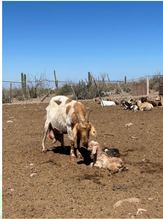
Figura 1. Cabra con su cría en la Sierra de San Francisco, Baja California Sur.

puede ser transmitida de la madre hacia las crías en las etapas pre y posnatal (Landau y Provenza 2020, Fig. 1).